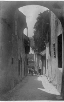
MARBURG a. D. Die Fleischergasse